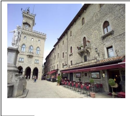
Stato di San Marino