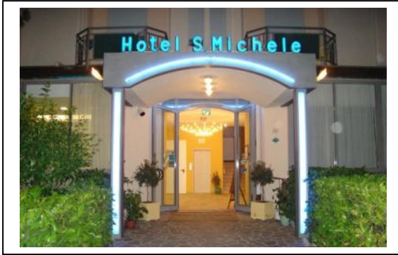
Hotel S. Michele Via Amaducci, 51, Carpegna PU