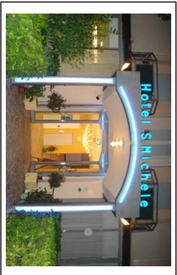
Hotel S. Michele Via Amaducci, 51, Carpegna PU